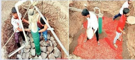
देऊर महाविद्यालयाच्या विद्यार्थ्यांनी राबवलेल्या या उपक्रमाने जलसंधारणात मोठी क्रांती घडवून आली.