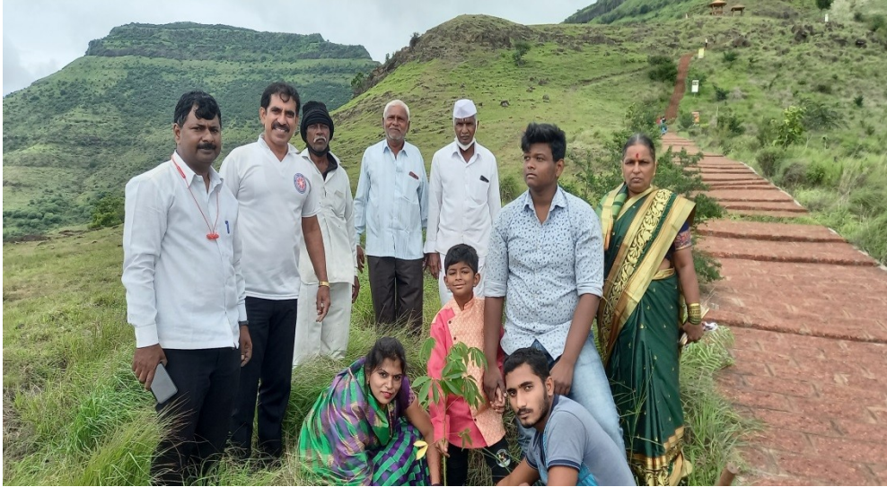
Tree Plantation of Fort Vandan on behalf of National Service Scheme and alumni prof. Sambhajirao Kadam college, Deur (Date: 15/08/2021)