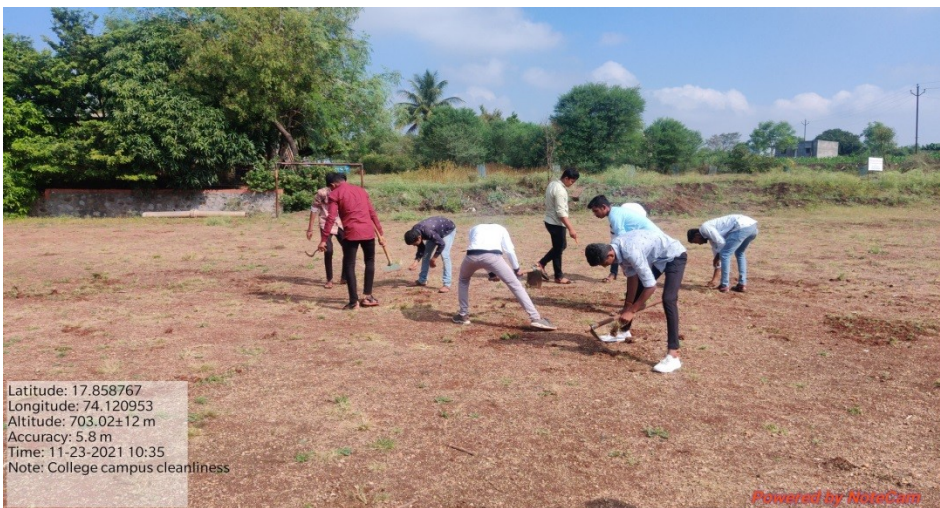
Latitude: 17.858767 Longitude: 74.120953 Altitude: 703.02±12 m Accuracy: 5.8 m Time: 11-23-2021 10:35 Note: College campus cleanliness