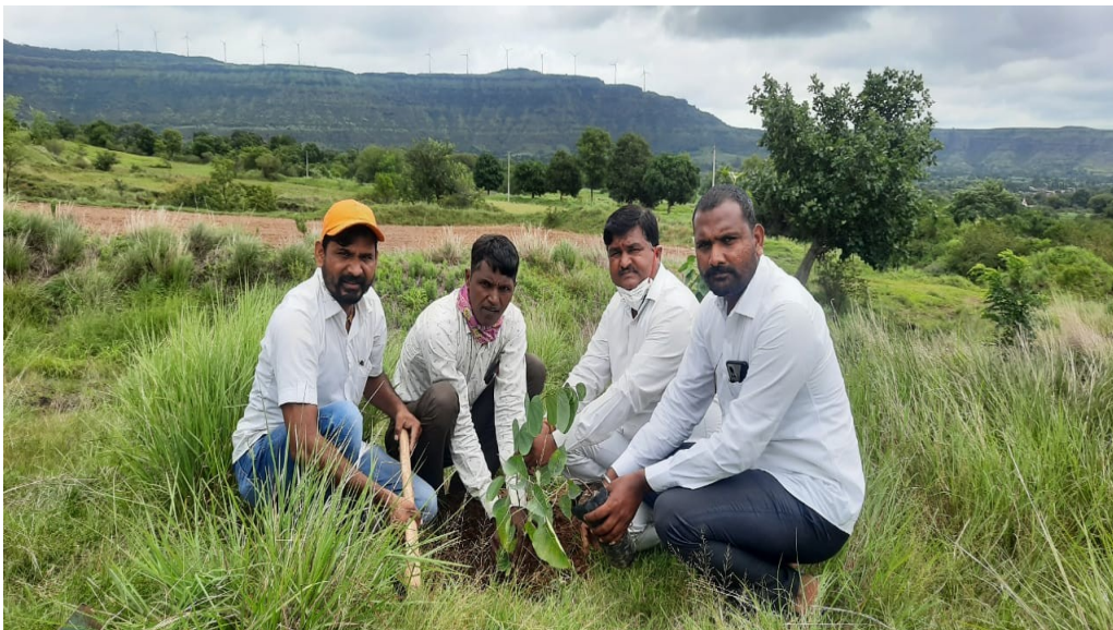
Tree Plantation of Fort Vandan on behalf of National Service Scheme and alumni prof. Sambhajirao Kadam college, Deur (Date: 15/08/2021)