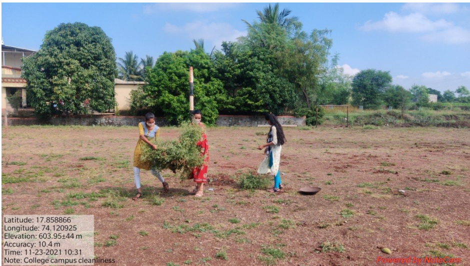
Latitude: 17.858866 Longitude: 74.120925 Elevation: 603.95±44 m Accuracy: 10.4 m Time: 11-23-2021 10:31 Note: College campus cleanliness