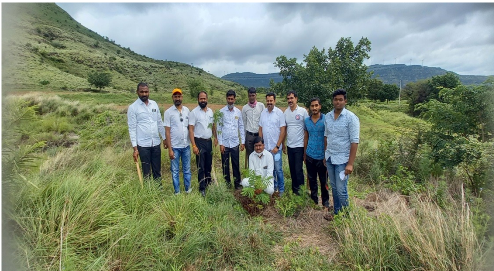
Tree Plantation of Fort Vandan on behalf of National Service Scheme and alumni prof. Sambhajirao Kadam college, Deur (Date: 15/08/2021)