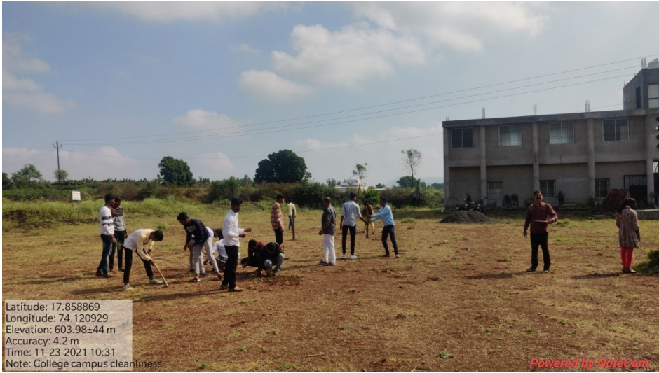
Latitude: 17.858869 Longitude: 74.120929 Elevation: 603.98±44 m Accuracy: 4.2 m Time: 11-23-2021 10:31 Note: College campus cleanliness