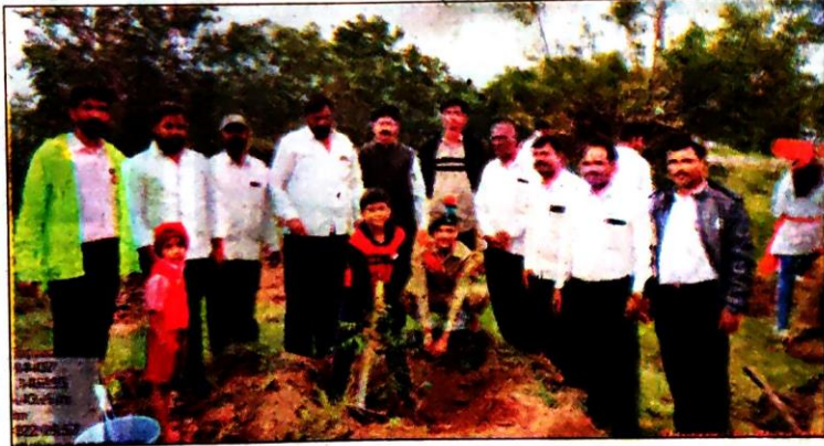
वृक्षारोपण करताना संकल्प अदाटे, शेजारी मान्यवर.

पारंपरिक वाढदिवसाला येणाऱ्या खर्चाला फाटा देत सामाजिक बांधिलकी जपत वृक्षसंवर्धनाचा संदेश द्यायचा असा