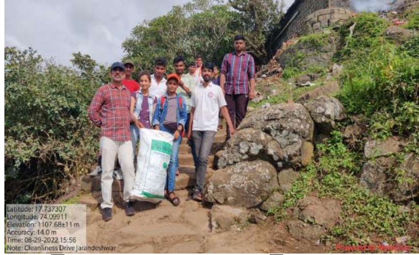
प्लास्टिक कचऱ्याने भरलेली पोती खाली नेतांना रासेयो कार्यकर्ते अधिकारी व रासेयो स्वयंसेवक

शिबीरात सहभाग घेतलेले विद्यार्थी खालीलप्रमाणेः