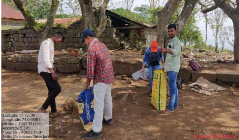
श्री क्षेत्र जरंडेश्वर मंदिर परिसरात स्वच्छता करताना रासेयो स्वयंसेवक