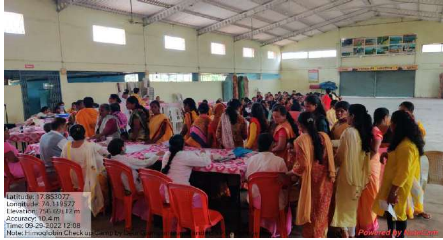
सर्व रोग निदान शिबिरात तपासणी करताना महाविद्यालयाच्या विद्यार्थिनी व महिला वर्ग