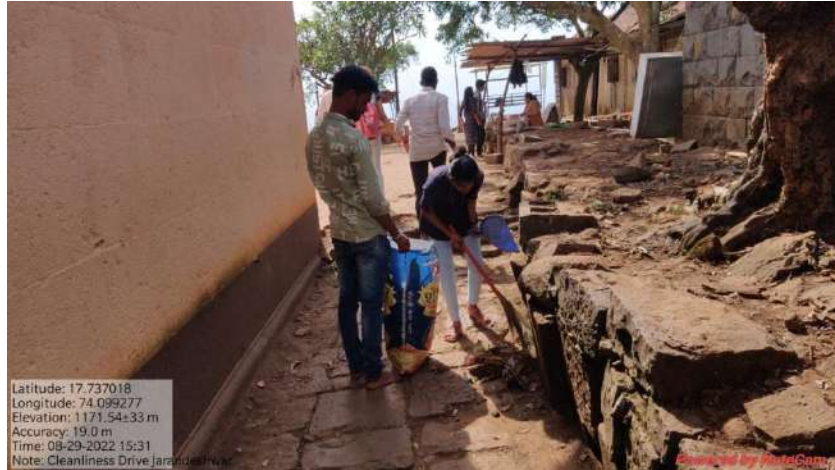
श्री क्षेत्र जरंडेश्वर मंदिर परिसरात स्वच्छता करताना रासेयो स्वयंसेवक