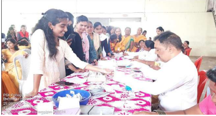
सर्व रोग निदान शिबिरात तपासणी करताना महाविद्यालयाच्या विद्यार्थिनी