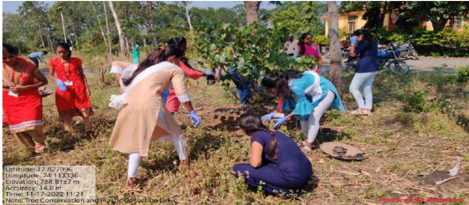
प्लास्टिक गोळा करताना महाविद्यालयाचे स्वयंसेविका