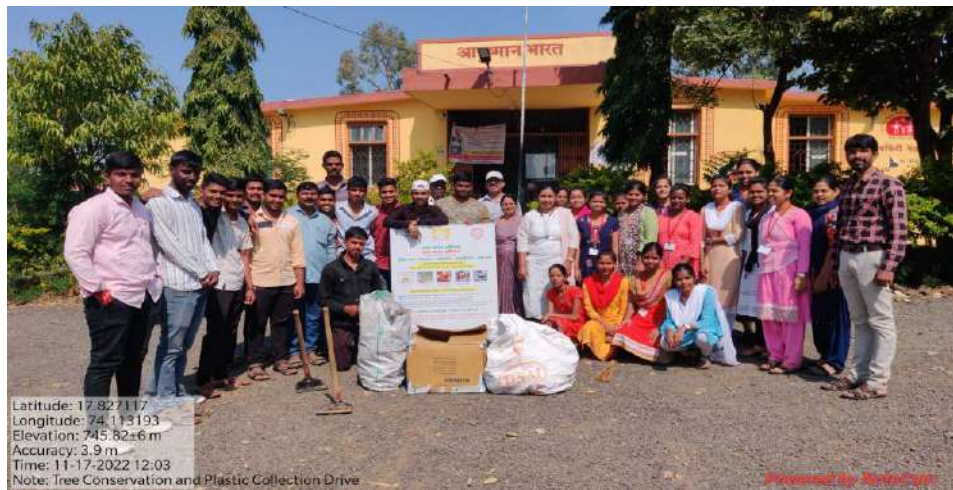
प्राथमिक आरोग्य केंद्र पळशी येथील गोळा केलेला प्लास्टिक कचरा महाविद्यालयाचे स्वयंसेविका व स्वयंसेवक