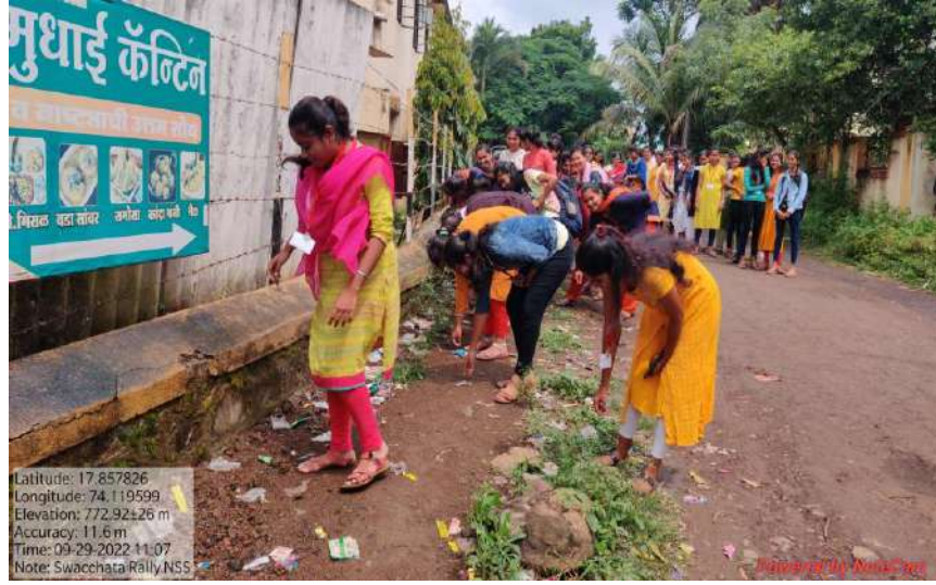
देऊर गावात स्वच्छता करताना महाविद्यालयाच्या विद्यार्थिनी