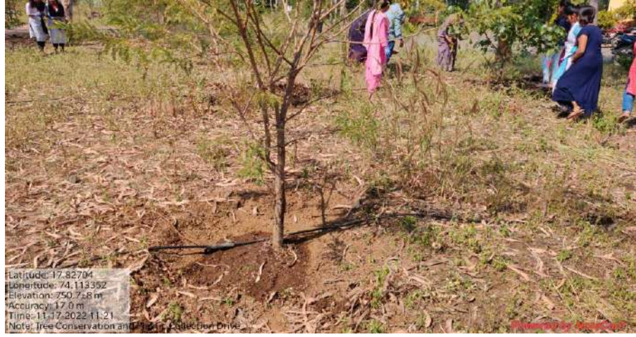
झाड संवर्धन करताना महाविद्यालयाचे स्वयंसेविका व स्वयंसेवक