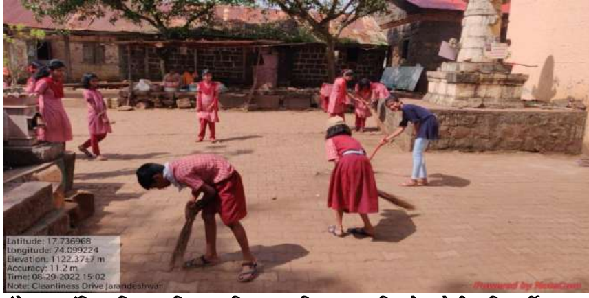
श्री क्षेत्र जरंडेश्वर मंदिर परिसरात जिल्हा परिषद प्राथमिक शाळा शिरदोण येथील विद्यार्थी स्वच्छता करताना